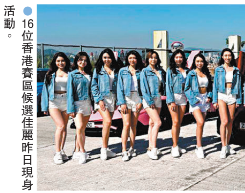
16位香港賽區候選佳麗昨日現身活動。