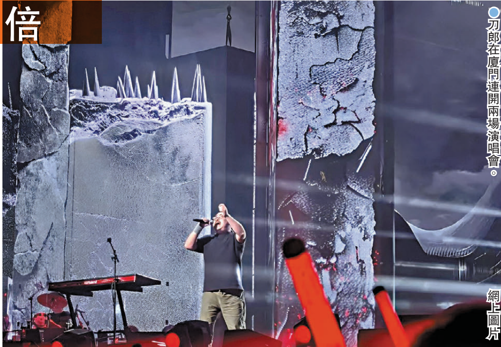
刀郎在廈門連開兩場演唱會。

據中國旅遊研究院4月21日發布的2023年全國遊客滿意度調查顯示,廈門入選全國遊客滿意度十佳城市,位居內地前三。「大力發展演唱會經濟,廈門未來可期。」福建省旅遊協會相關負責人稱,演唱會經濟不僅能帶動「吃住行遊購娛」旅遊鏈條發展,還能有效提升廈門旅遊美譽度。刀郎演唱會也證明,演唱會帶來的旅遊消費增長相當可觀,不僅可通過多種方式打包銷售旅遊產品,還可通過「演唱會+旅遊」產品線路、景區景點個性化服務,進一步拉動廈門消費經濟。廈門大學管理學院助理教授劉斌亦表示,對於大部分歌迷來說,歌手開的不僅僅是演唱會,更是個性與回憶,為他們提供了更多的情緒價值,「正因如此,廈門這座旅遊城市才被持續關注,一波波的流量跟着湧入,助力打造全新的『全域演出城市』」。