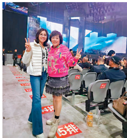
香港「刀迷」飛到廈門觀看12月1日晚上的刀郎演唱會。

飛豬、美團等數據顯示,這次刀郎廈門演唱會在當地周邊的酒店民宿預訂量同比超10倍以上,部分熱門酒店甚至「一房難求」。廈門市島嶼發展局相關負責人介紹,他們此前有組織過蔡依林、林俊傑等歌手觀影活動的經驗,這次特別安排住宿包免費的穿梭巴士接送歌迷到演唱會會場,周末兩日住宿率都超預期。