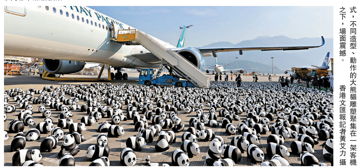
●二千五百隻大熊貓雕塑昨日在機場舉行歡迎儀式，不同造型、動作的大熊貓雕塑聚集在一架客機之下，場面震撼。

熊貓大家庭帶來的歡樂，相信多個別開生面的展覽活動，將有助宣傳香港獨特且多元化的旅遊形象，該局同時會聯繫社會不同界別推出一連串宣傳，除了製作「召集世界好友暢遊香港」電視宣傳片，更會在城中多個地點，包括港鐵、中環碼頭、半山扶手電梯等，加添熊貓主題宣傳。未來旅發局一些大型活動，亦會加入更多熊貓元素，為旅客及市民帶來加倍歡樂。