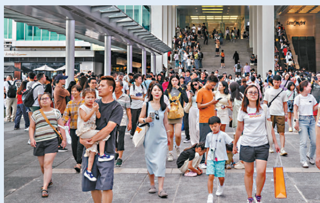
●港元偏強時間或會延長，影響本地貨物及服務的吸引力，將抑壓市民及旅客在港消費。

香港文匯報訊(記者 蔡競文)財政司長陳茂波昨指出，2025年環球經濟仍面對很多不確定因素，特別是美國新一屆政府的經濟政策，香港作為細小外向型經濟體難免會受影響。他預期，美國新政府將實施擴張性財政政策，可能增加當地通脹壓力，減息節奏或放慢，影響香港利率走勢，港元偏強時間會延長，影響本地貨物及服務的吸引力，抑壓市民及旅客在港消費。