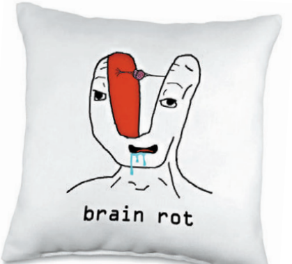
●商店為「Brain Rot」推出產品。網上圖片

牛津大學出版社詞典部門總裁格拉斯沃爾表示，它的流行反映社媒推動語言變化的速度驚人。