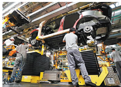
●日產汽車近期陷入破產危機。網上圖片

面對銷售惡化，日產宣布將2024年度盈利預期大幅下調70%，降至1,500億日圓（約77.7億港元），並擬出售持有的10%三菱汽車公司股份。有消息指老對手本田可能收購日產股權，日產則希望銀行或保險公司等長期穩定股東接手。