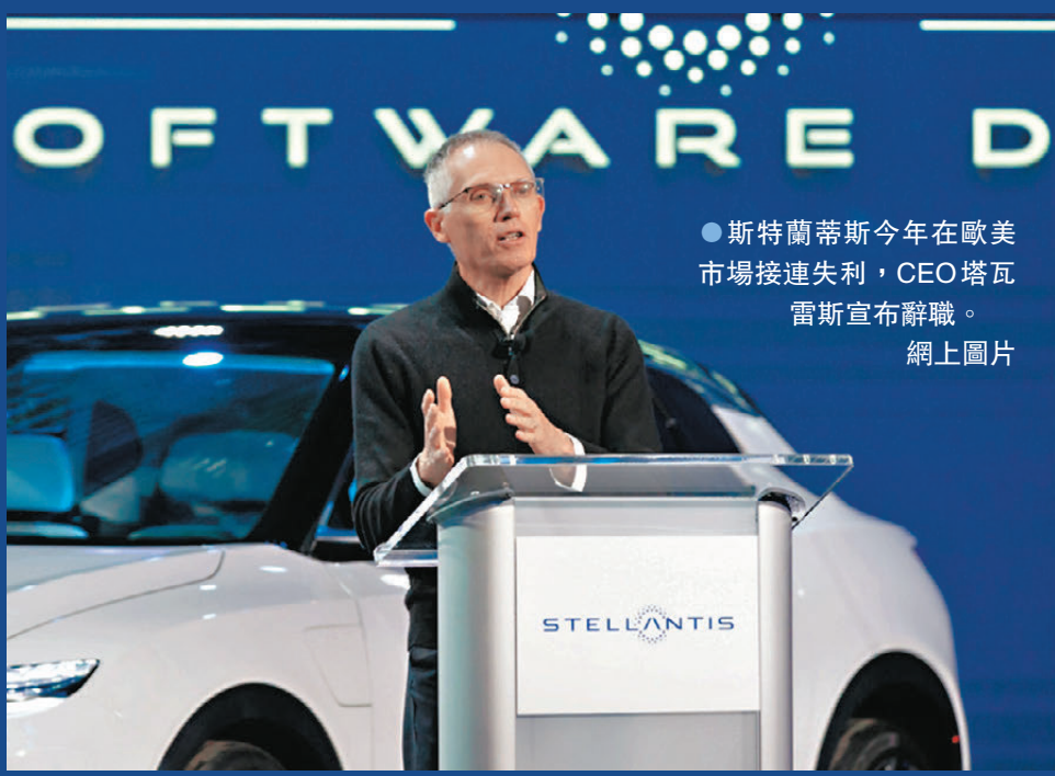
●斯特蘭蒂斯今年在歐美市場接連失利，CEO塔瓦雷斯宣布辭職。網上圖片

香港文匯報訊 據路透社報導，全球第4大車企斯特蘭蒂斯集團行政總裁塔瓦雷斯周日（12月1日）突然宣布辭職。斯特蘭蒂斯今年在歐美市場接連失利，股價累跌逾四成，從歐洲最賺錢車企淪為表現最差車企，其面臨的困境正揭示歐美汽車業的寒冬。