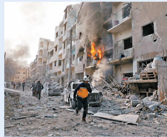
●敘政府軍奪回阿勒頗數個城鎮控制權。