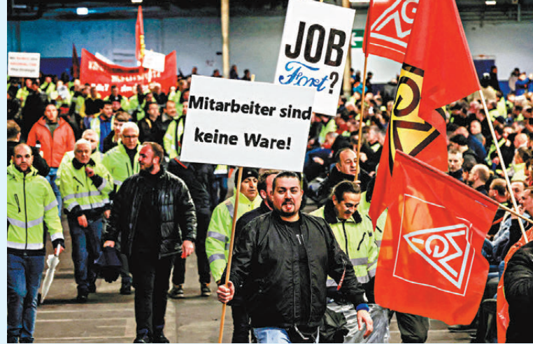
●福士工人在科隆工廠罷工，高舉寫有「員工不是商品」橫額。

福士早前指出，公司可能需要在德國關閉工廠，這也是該汽車巨頭87年來首次在德國警告關廠風險。