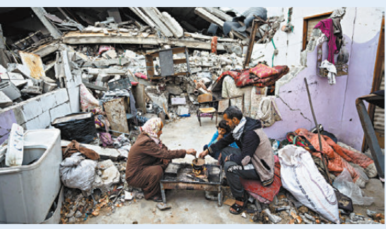
●巴人在加沙被毀的家門外煮食。

商營收平均增幅僅0.2%，但在俄烏衝突相關需求推動下，若干歐洲製造商的軍火營收大幅增長，尤其是製造彈藥和防空系統。受哈以衝突爆發影響，中東地區軍火商營收平均增長18%。