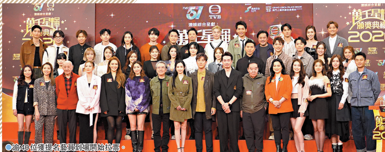
逾40位獲提名藝員到場開始拉票。