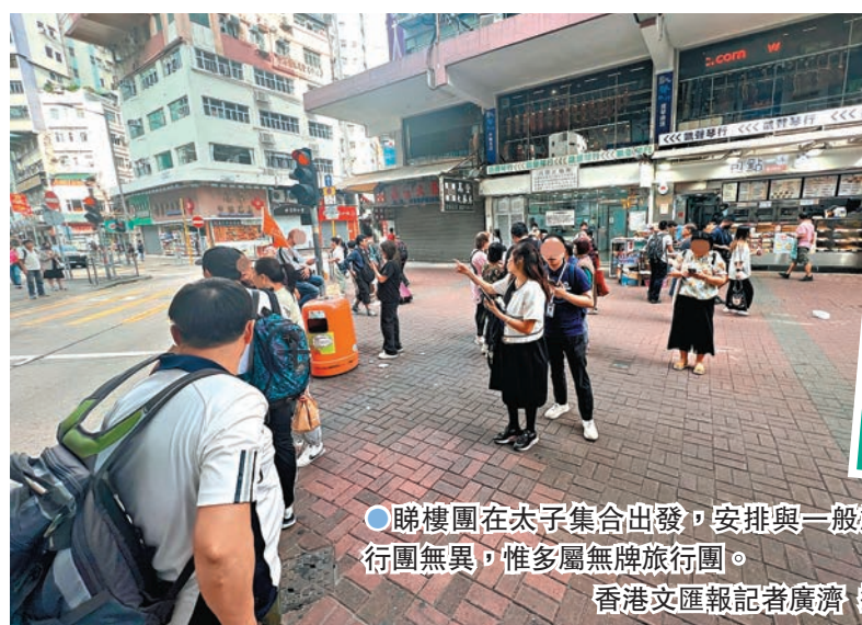
睇樓團在太子站集合出發，安排與一般旅行團無異，惟多屬無牌旅行團。

店方不放棄半點賺錢機會，竟派發技師24小時監視，倘發現有人未睡或四處走動，即上前詢問是否需要自費接受按摩。有團友難耐滿肚子氣，突破技師重圍到康樂室透透氣，使用簡陋的免費娛樂設施打發時間。