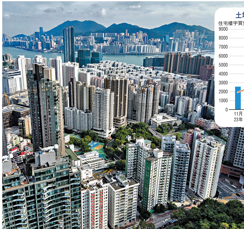
土地註冊處過去一年住宅樓宇買賣合約數目統計