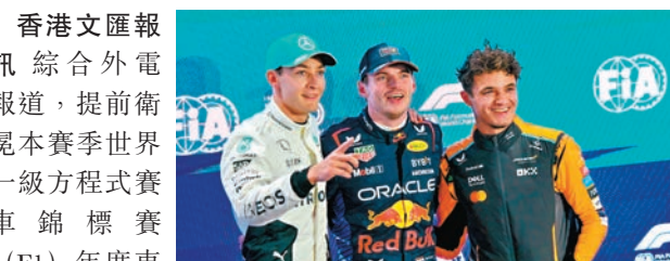
●韋斯達賓(中)批評羅素(左)的待人處事。 資料圖片

香港文匯報訊 綜合外電報導，提前衛冕本賽季世界一級方程式賽車錦標賽(F1)年度車手總冠軍的紅牛車手韋斯達賓，上周六排位賽比羅素快0.055秒，但在裁判調查中，他被指在與平治車手羅素發生事故時「不必要慢駛」而被罰退一位發車，羅素升到排位賽第一位，這是有關規則在2022年生效以來第一次有車手遭罰退位。兩人被召到裁判房接受聆訊，但過程中鬧得很不愉快，韋斯達賓指自己已多次到過裁判房，「但從沒見過有人試圖如此嚴厲地對待別人」，批評羅素的待人處事，坦言已對這位英國車手「失去所有尊重」。