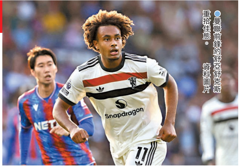
●曼聯前鋒舒亞舒克斯重拾佳釀。