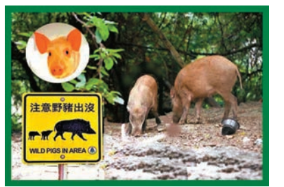
同豬何以不同命。

多年前行 逍遙自在？ 山，回程時都 善待野豬，倒不如跟家豬一視同仁，讓牠們好好飽吃一頓日子以後，為人類口福而後犧牲，以完成上天給與牠們的使命；只要人們給與任何食畜減少痛苦的人道毀滅，也是好生之德。 野豬可吃嗎？許多年前跟團旅遊台灣，當中有人提議某處可以買到野豬肉乾，好奇的團友一呼百應，筆者便也嘗過那種肉味，但是分辨不出和家豬有什麼差異，家豬本來就是數千年馴化出來的野豬，可能野豬多吃了今日人類的食物，不自覺已跟家豬同化了。 《紅樓夢》第53回〈榮國府元宵開夜宴〉收到的禮物單中，看到除了大鹿/獐子/狍子等野生動物，還有暹豬/湯豬/龍豬和野豬各20頭，始知原來豬有那麼多種，其中當然最矚目是「野豬」，這樣說來，為野豬超生亦無不可。 近年大多數國家人口出生率下降聲中，據說野豬生殖力卻旺盛到大量「增加生產」，而且繁殖得快，漸漸活動範圍不止流連山區，甚至橫行到鄉村和城市，威脅到農作物和人命安全，國家正打算放棄將之列為保護野生動物了，不同意見的個別愛護動物人士不知道有沒有想過，野豬之野、野豬之兇，不外因飢餓而起，看牠們永遠吃不飽那副可憐兮兮的樣子，難道還以為野豬在山林會像熊貓般活得那麼