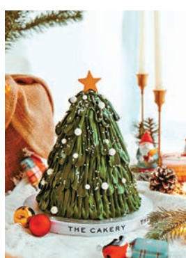
●純素流心開心果聖誕樹蛋糕