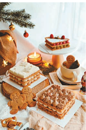
●聖誕版本的純素千層酥

聖誕節將至，致力為食客締造更健康生活的本地純素烘焙店 The Cakery，今年推出多款應節造型蛋糕，重點推介打卡一流的純素流心開心果聖誕樹蛋糕，矚目的聖誕樹造型流心蛋糕內餡加入大量開心果碎，外層以開心果甘納許作點綴，切開後開心果內餡湧出來，入口濃稠香滑，濃郁的開心果味與絲滑的口感交織。賣相精緻可愛的無乳製品伯爵茶魯道夫戚風蛋糕，無添加任何乳製品的鬆軟伯爵茶戚風蛋糕，夾着煙韌的黑糖麻糬，外層配上柔滑的伯爵茶甘納許，甜而不膩。