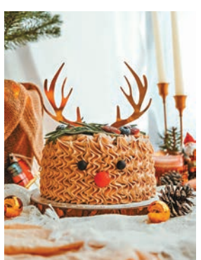
●無乳製品伯爵茶魯道夫戚風蛋糕

素千層酥，將經典甜點升級，氛圍感十足的聖誕雲呢拿夢幻千層酥以純素千層酥皮搭配口感輕盈的雲呢拿甘納許，加上閃耀的白雪花和銀箔作點綴。大家另可選擇加入以白朱古力甘