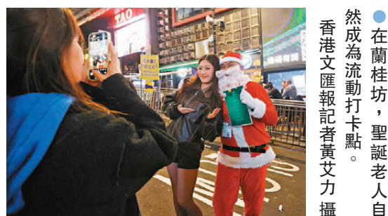
●在蘭桂坊，聖誕老人自然成為流動打卡點。

他表示，本港聖誕節日氣氛濃厚，不少市民留港消費，加上各區有不少大型聖誕燈飾及布置，成功吸引內地旅客來港感受聖誕氣氛，特別在深圳居民恢復「一簽多行」後，方便更多內地年輕人來港消費，有利酒吧市道。