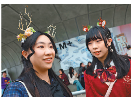
▲吳小姐(左)與謝小姐(右)