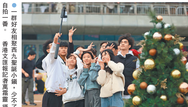
●一群好友相聚西九聖誕小鎮，少不了自拍一番。