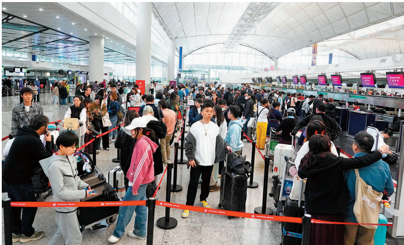
●機場離境大堂早上已人頭湧湧，多個登機櫃位出現人龍。

另外，港珠澳大橋發出提醒，因應港澳聖誕節公眾假期，大橋珠海公路口岸通關或將迎來車流、客流高峰，呼籲一眾司機及旅客錯峰安排出行計劃。人流及車流入境內地高峰最早為昨日(24日)傍晚開始出現。市民可透過「香港出行易」查閱港珠澳大橋香港口岸出境及入境客車通關廣場的交通快拍，以及透過「港珠澳大橋珠海口岸」或「珠海發布」微信公眾號內的「大橋口岸實時通關」服務，查詢大橋珠海口岸的車輛實時通關情況，以便及早計劃行程。