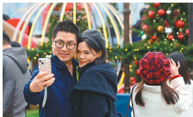
●一對情侶依偎著合照。