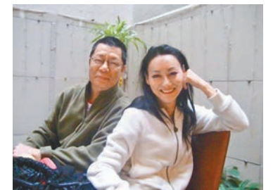
●惠英紅來我家作客，在後院與我的外子拍照留念。

星；他們不單止是獨孤精，還是自私精，我們住舊房子，有幸有個「後院」，我有這個後院覺得很高興，當年老公身體狀況好，把後面的地方堆堆砌砌，搞得似模似樣，那幾年引來一班好朋友，大家經常組局，在後院打邊爐燒烤、飲酒、吹水，自從獨孤精搬來，他們不喜歡我們熱鬧，說影響他們休息，大抵因為這個原因，他們把我們當仇人，不單警告我們，還把垃圾堆滿後院，不清潔不掃掃，天晴曬落雨淋，變成一個藏污納垢的小型垃圾站，簡直可惡到極點。 貼門有自私精鄰居，應該是不幸的，猶幸對門的又很不錯，一位近百歲外籍老太太，有幾個女傭照顧，他們跟咱家都很友好，我們遇上困難，她們會主動幫助，這樣的鄰居抵消了貼門的鄰居帶來的對心情不良的影響。