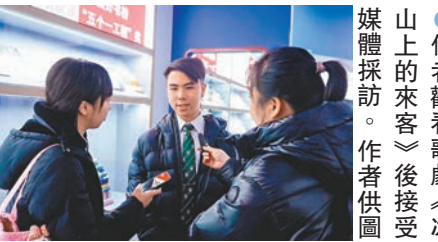
●作者觀看歌劇《冰山上的來客》後接受媒體採訪。

到，一種厚重的文化、一種源遠流長的精神，在滋養着我。在北京故宮的每一刻，我的內心都在反覆寫着兩個字：「華夏」。如果說，作為一名香港青年，我是祖國的花朵，那麼這種文化的滋養與澆灌，不僅必要，而且意義深遠，它讓我強烈地感到，我是一名中國人，我是一名炎黃子孫，我的血液裏流淌着屬於華夏的基因，我是多麼的自豪和幸福。 之後的幾天，我登上鐘鼓樓，鳥瞰北京城，中軸線文化近在咫尺，又那麼浩瀚無垠；我來到王府井，在中華老字號聚集的步行街，感受北京中軸線的發展和生活方式的變遷。 燈下，當我拿起文學的筆，記下這寶貴的經歷，耳邊又一次響起《花兒為什麼這樣紅》那動人的旋律：「……花兒為什麼這樣鮮，鮮得使人不忍離去，那是用了青春的血液來澆灌……」我青春的熱血，縱然不是在戰爭中揮灑，但也必須將自己的志向、理想和信念，融入到為中華民族偉大復興而奮鬥的每一天；用中華文化的博大、用日日精進的學業，把那生命的花朵，澆灌得愈來愈紅、愈來愈鮮。