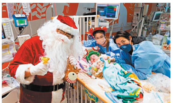
香港兒童醫院員工化身聖誕老人，探訪新生兒深切治療部，與初生BB慶祝他們的首個聖誕節。

香港文匯報訊(記者洪澤楷)節奏輕快的聖誕歌再次在大口環根德公爵夫人兒童醫院和香港兒童醫院響起，平日披上白袍的醫護人員穿上五彩繽紛的聖誕或卡通人物服飾，與住院病童一同唱歌、玩遊戲，以愛與陪伴為平日清冷的醫院增添一絲暖意，為病童打氣，讓他們知道治病路上從不孤單。部分病童雖只能坐於輪椅上，眼睛跟著音樂與歌曲搖頭拍子，神情十分興奮。