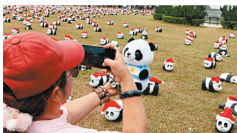
市民、遊客中山公園打卡忙。

此外，主辦方亦將於本週六(28日)晚上8時15分，在西九文化區舉行全港首場「PANDA GO! 香港遊」煙火無人機匯演。該匯演將以無人機及煙火搭配的形式，於空中繪出不同形態的大熊貓以及富有香港特色的圖案。