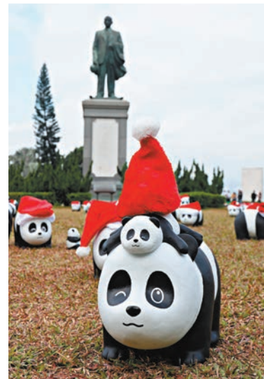
熊貓公仔雲集中山紀念公園。小朋友穿上熊貓裝與熊貓雕塑合照。