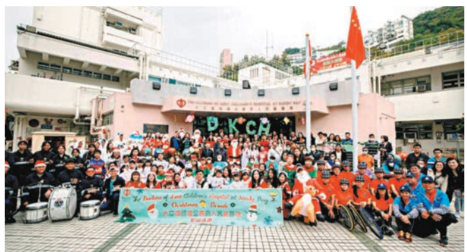
大口環根德公爵夫人兒童醫院職員與義工扮成卡通人物、聖誕老人，為住院病童舉辦聖誕巡遊。