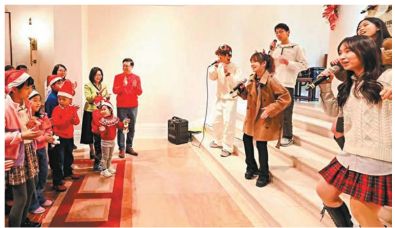
香港科大無伴奏合唱團到禮賓府為大家頌唱聖誕歌。

香港文匯報訊 昨日適逢聖誕節，香港特區行政長官李家超在社交媒體上向市民送上祝福，祝願大家聖誕快樂。李家超與夫人林麗嫻日前邀請南昌社區客廳的家庭到禮賓府參與聖誕派對，並邀請科技大學無伴奏合唱團到禮賓府頌唱聖誕歌，分享佳節喜悅。小朋友和大學生除獲贈聖誕禮物外，也獲李家超親筆題寫的聖誕卡。李家超表示，派對當天獲邀的家庭為禮賓府的貴賓，並高興聽到社區客廳為這些家庭提供額外空間，改善生活質素，政府會繼續努力在施政上惠民生、添幸福。