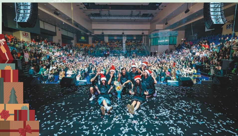
▲金賢重與港迷們合影。

而來到安哥部分，金賢重為慶祝聖誕節，便戴上鹿角頭飾，並披上聖誕圍巾，展現其可愛一面。他先以《I'm Yours》答謝歌迷多年支持自己的心意，接着他再深情地對歌迷表示：「2024年結束前可以在香港和粉絲一起度過最後一站，十分幸福。」而歌迷們亦戴上了聖誕帽，全場合唱聖誕歌歡度佳節。在唱到結尾歌曲《MOONLIGHT》時，金賢重更走到觀眾席近距離跟觀眾見面，並用韓文約定大家：「我已經出道20年，多謝大家一直以來的陪伴，希望與大家一起過30、40、50周年。」最後，他與全場觀眾拍攝大合照，並以粵語約定港迷：「香港下次見！」