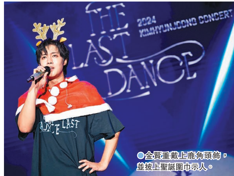
●金賢重戴上鹿角頭飾，並披上聖誕圍巾示人。

香港文匯報訊 韓國SS501出身的歌手金賢重日前假香港麥花臣場館舉行個唱，恰巧香港站的演唱會是巡演的最後一站，同時適逢冬至，金賢重特別為觀眾們準備了20多首歌曲，總共兩個小時的精彩演出，向香港歌迷送上陣陣暖意。