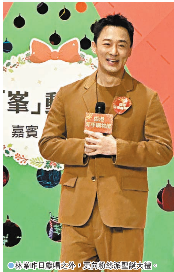
●林峯昨日獻唱之外，更向粉絲派聖誕大禮。

林峯昨日出席「香港冬日美食節2024」活動，與大家共度聖誕節，當他看到現場坐了數十名粉絲和觀眾，他高興說：「好多人，好開心！好似為明年的演唱會做預演。」他透露明年工作大計，表示工作方面相當充實，除了唱歌外，亦有電影作品會上映，農曆新年過後並會開始拍攝新作品，3月就要準備5月舉行的紅館演唱會，並指新年願望，是希望繼續有好作品送給大家，以及希望所有香港朋友最重要是闔家平安、身體健康！憑《九龍城寨之圍城》榮登影帝的他獲稱讚動作戲了得，又能歌善舞，名符其實打得又跳得，林峯幽默分享心得說：「我是被人打咋，哈哈；其實做任何事，最重要是保持心態。」