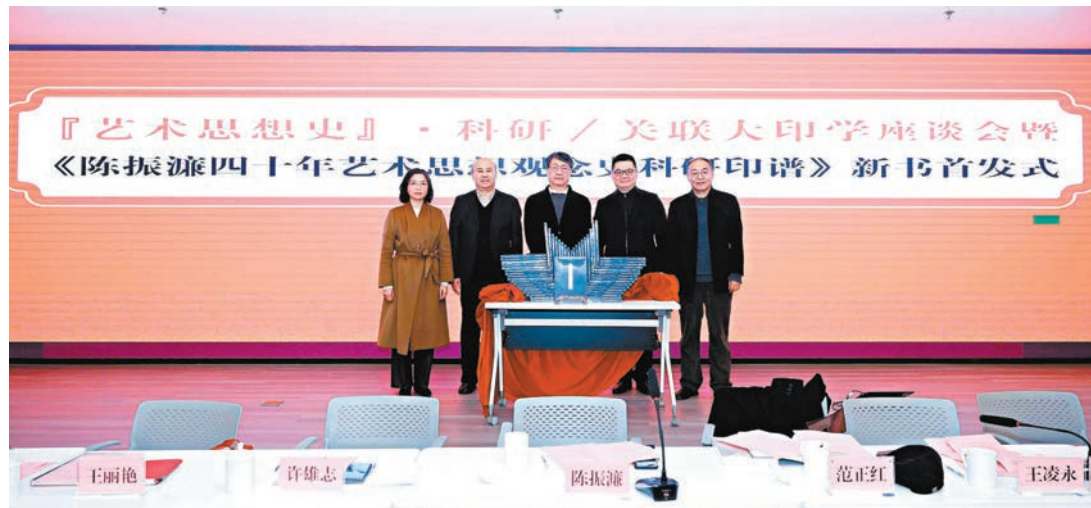
● 《陳振濂四十年藝術思想觀念史科研印譜》新書首發式。

今次展覽是一次主題性篆刻藝術創作，匯聚了54名西泠印社中堅與才俊之士，以中國文聯副主席、西泠印社副社長兼秘書長陳振濂從藝40年總結的藝術思想關鍵詞為創作主題，呈現了54件精品力作。此次創作的每一個關鍵詞，都有理論體系作為支撐，體現了陳振濂的學術修養。展覽將持續至2025年2月16日。