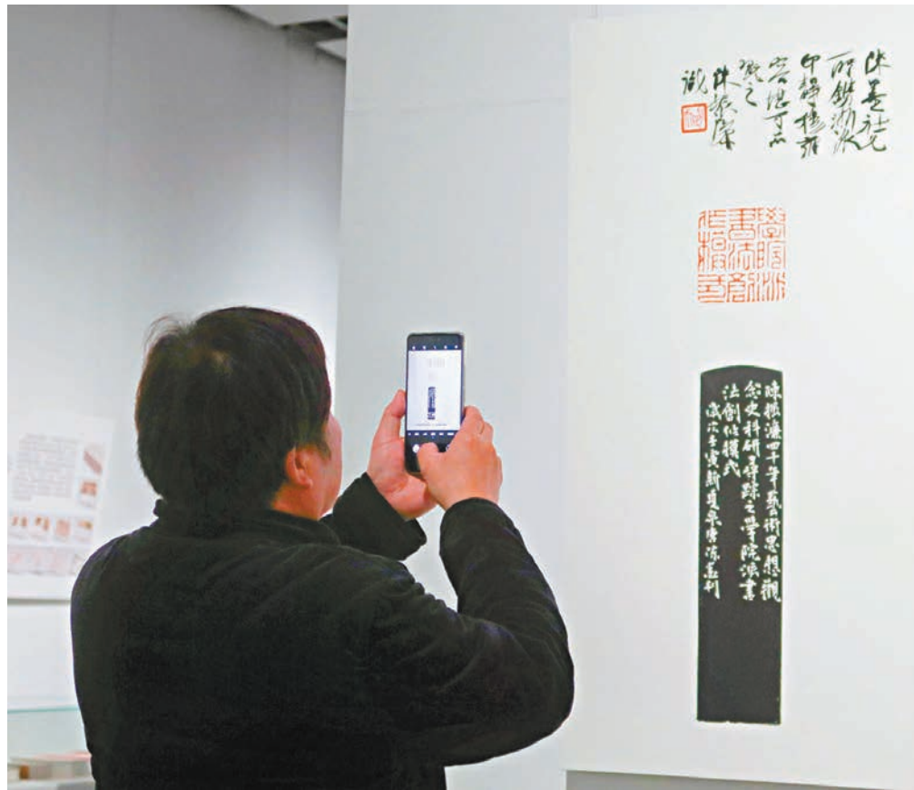
● 觀眾參觀篆刻展覽。

由西泠印社集團主辦，西泠印社出版社、西泠印社美術館承辦的「藝術思想史」·科研/關聯大印學陳振濂四十年藝術思想觀念史科研印譜展開幕式、《陳振濂四十年藝術思想觀念史科研印譜》新書首發式暨座談會12月9日在浙江杭州西泠·武林美術館舉行。