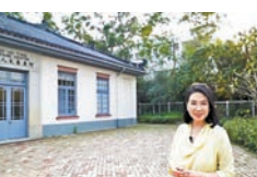
舊色園的活化建築項目：何東夫人醫局·生態研習中心。

二十世紀初的香港，醫療服務非常不足，分娩大多由傳統的「產婆」在家接生，在新界偏遠地區的情況，尤為嚴重。醫局的西式醫療設備，對當時的產婦及嬰兒護理，發揮了極大效用。關於建立醫局的淵源，不得不提1912年何東夫人所創的「東英學園」。(待續)