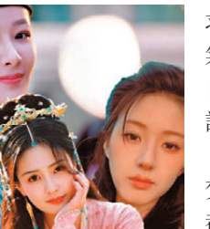
楊紫、白鹿及趙露思是當紅女星。

不相識，由此踏上結伴而行的奇異之旅，一路攜手除妖降魔的故事。《白月梵星》推出後，劇壇是非不絕，楊紫與白鹿的粉絲互相攻擊，誰勝誰負每天都在網絡上鬧得沸沸揚揚。楊紫白鹿2歲，都是30出頭，我常說這是女演員最黃金的階段，捱過了出道日子的辛酸血淚，闖出了名堂，爬上了一線，實在不容易，特別在網絡年代，每天熱搜的壓力，非一般人能撐得住。 最近趙露思的新聞，正好說明當藝人的「苦」，真的是苦不堪言，城市人情緒緒病都已是罕見，藝人更加是有苦自己知，未紅想紅，紅了又要撐着，當然「冰凍三尺，非一日之寒」，趙露思的問題背後仍有很多公眾無法知曉的，但看上一輪她主演的《珠簾玉幕》，也是要硬撐虞書欣的《永夜星河》，當時，粉絲、輿論、劇評紛紛拿來做比較，承受的壓力實在不小。其實，趙露思在《珠簾玉幕》中都流露出很累的身體語言，還以為是劇本和導演的要求，總覺得已失去她那種靈氣。作為她的粉絲，希望她早日能解決和經理人的關係，保護好自己的身心靈健康。 這次《國色芳華》與《白月梵星》對決，但願楊紫和白鹿都能處之泰然，一切爭鬥，都不過市場把戲，藝人如是，劇迷也應輕鬆面對。