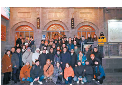
《天下第一樓》全體演員在全聚德老店門前。

燕京八景廳，我已預先訂好六圍，新年前的最後兩天，是所有餐館最忙的時候，能訂到這樣的大廳，真要感謝總店初、周兩位老總的大力支持。當晚吃的是全鴨席。在戲中堂頭（大堂經理）常貴唱出全鴨席的菜單：「這是用鴨身上的舌、心、肝、胗、胰、腸、脯、掌做成的菜，醬鴨心、鴨鴨胗、芥末鴨掌、鴨四寶、燒鴨心、燴鴨腰、清炒鴨腸、鴨茸包，學名全鴨席。」這一晚，也是全鴨宴，菜單是「風味六冷盤」：鴨掌、鴨絲、鴨腸、鴨肝、鴨血、鴨胗、燴烏魚蛋湯、芝麻鴨方、魚香蝦球、火爆鴨心、板栗紅燒肉、松鼠鱈魚、砂鍋牛腩、乾燒鮑魚鴨脯、蘆筍百合，以及全聚德盛世牡丹烤鴨，加美點雙輝，為了讓香港客人吃好吃飽，烤鴨隨吃隨上，還特別贈送了精美如同工藝品、擺放在紅木架上的各式小點心，大家只顧拍照，簡直不捨得吃。