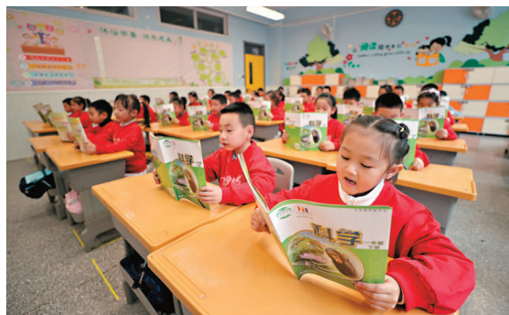
●內地將探索擴大免費教育範圍，還可探索實行免費學前教育。圖為山西太原的小學生在教室上課。