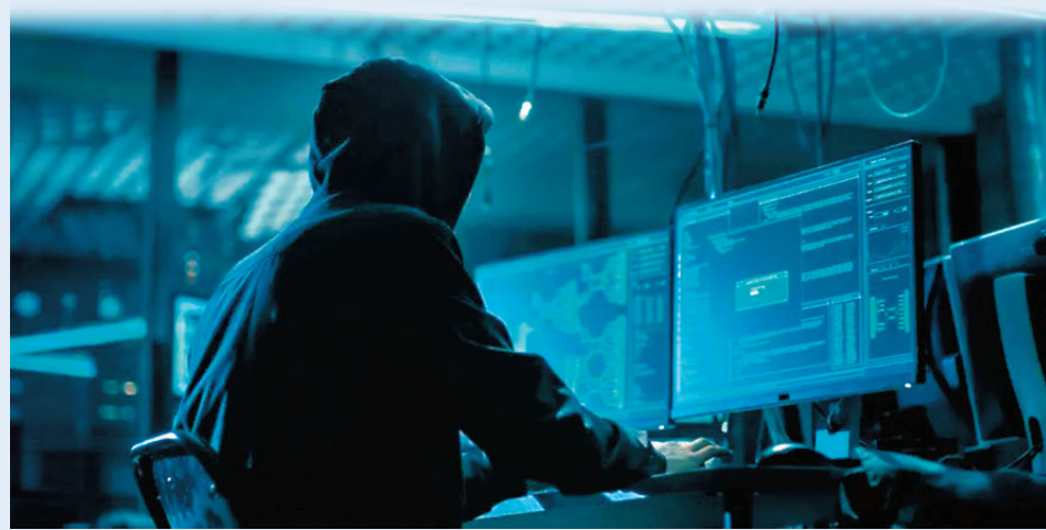
●中方指出，美對華實施長時間系統性大規模的網絡攻擊。