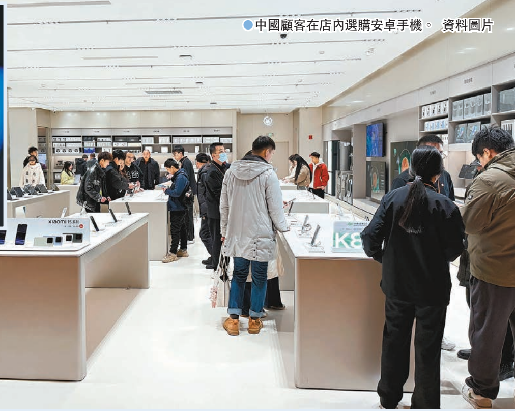
●中國顧客在店內選購安卓手機。資料圖片