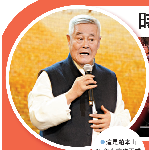
●這是趙本山15年來首次正式重新登台演出。