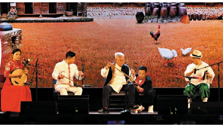
●趙本山團隊現場演奏傳統民族樂器。