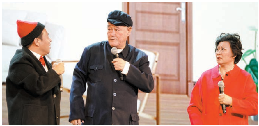
●趙本山上場的首個節目是《排戲》。