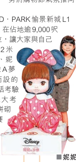
■妮妮與沙奈公仔好可愛。

除期間限定店外，部分玩具更以低至5折的價錢限量於網店(https://bit.ly/3hjrKvk)發售，包括高達UNIVERSE套裝(300元)、米奇收銀機及足球套裝(250元)等，亦有玩具回收捐贈行動，將舊玩具轉贈基層兒童外，亦可獲20元期間限定店優惠券，送完即止。