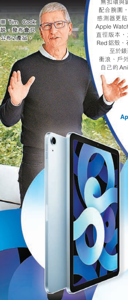
Tim Cook 說，發布會只公布 2 產品。