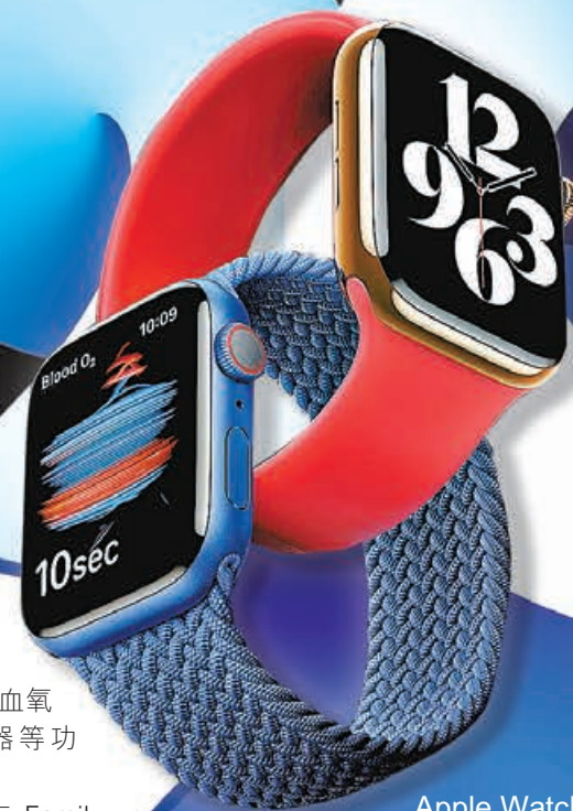
Apple Watch 6 HK$3,199 起

另有 Apple One 綜合計劃，讓大家只要一個價錢，就可以享用不同的蘋果服務，暫時提供 3 個服務計劃，包括個人、家庭及 Premier。例如個人服務就有 Apple Music、Apple TV+、Apple Arcade 及 50GB iCloud 儲存空間，月費 14.95 美元 (約 116 港元)。惟 Fitness+ 及 Apple One 仍未於香港推出。