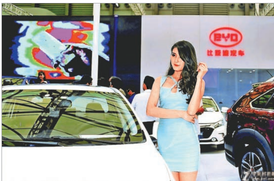
■比亞迪昨日續升6.47%，報收103.6元，再現歷史高位，成為港股焦點股之一。

恒指收盤報24,725點，下跌7點或0.03%。國指收盤報9,845點，上升16點或0.17%。另外，港股主板成交金額有1,029億多元，而沽空金額有137.2億元，沽空比例13.33%。至於升跌股數比例是846：907，日內漲幅超過12%的股票有44隻，而日內跌幅超過10%的股票有29隻。