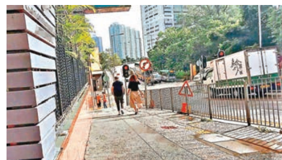
■疑似隔離人士離開酒店。

因酒店不為隔離人士提供膳食，故不時有外賣員或住客的家人自出自入。記者遂假扮外賣員跟隨真外賣員一同前往該疑似隔離樓層，模仿該外賣員敲另一間房門，一位帶着孩子的女士開門後稱：「無咗外賣！」記者便稱「行錯樓層」，並趁機詢