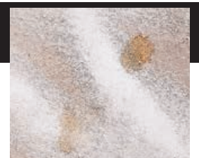
■被褥上有血漬，令人作嘔。

排出室外。但倘若該酒店排氣管主喉外無強力的抽風系統，管道中的廢氣則可能由於空氣壓力，流向未開啟抽氣扇的房間，隔離房間的廢氣會經抽氣扇，傳至非隔離房間造成疫症擴散，廁所抽氣扇會是製造「毒氣室」的元兇。黃勁松提醒市民，盡量在離開酒店房間及睡覺時都保持抽氣扇開啟。（尚有相關新聞刊P.2）