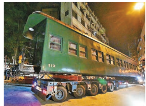
■313號火車卡趁凌晨由市區運送往大埔。

車卡被修復後要從長沙灣運送到大埔。由於313號火車卡幾乎等於兩輛雙層巴士，文物修復辦事處館長謝志遠指，這次是香港的博物館歷來最大型的陸路運送文物項目。文物於本年5月底正式運送，運送隊伍選在凌晨時分出發，棄隧道取道陸路，途經青葵公路、屯門公路、新田公路、上水、粉嶺，再到大埔，全長約60公里。