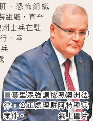
■莫里森強調按照澳洲法律，公正處理駐阿特種兵案件。

在911恐襲後，澳洲派出2.6萬名軍人前往阿富汗，聯同美軍及盟國派出的軍隊，追剿塔利班、恐怖組織「基地」和其他伊斯蘭武裝組織，直至2016年全面撤軍。然而澳洲士兵在駐阿富汗期間涉嫌犯下的罪行，陸續被傳媒曝光，包括有士兵在入屋搜查時殺死一名6歲兒童、砍斷敵人雙手，以及為騰出直升機上的位置，而殺死一名囚犯，還有多宗槍殺手無寸鐵平民的事件。