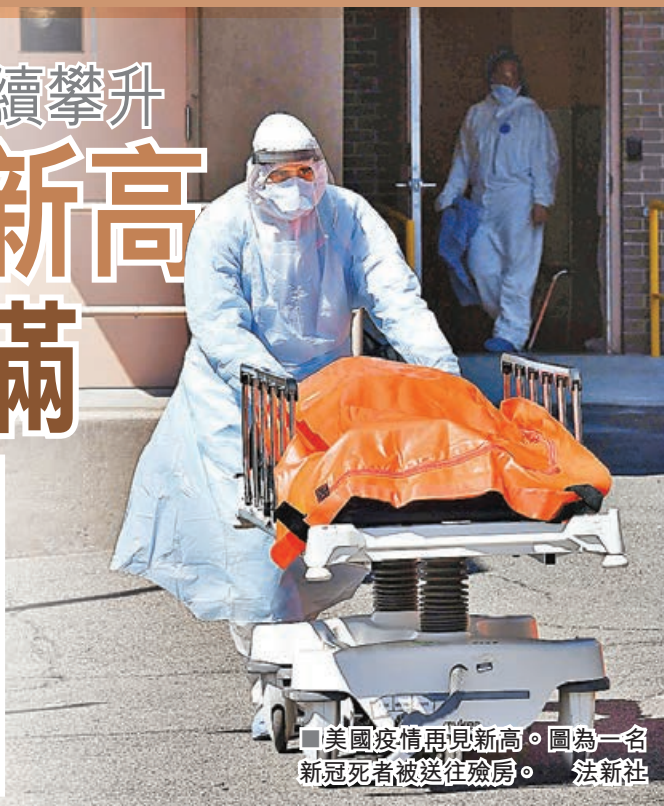
■美國疫情再見新高。圖為一名新冠死者被送往殯房。

另據美國有線電視新聞網報道，目前，全美各地的醫院都已不堪重負。10月份，全美有15個州的新冠肺炎住院患者人