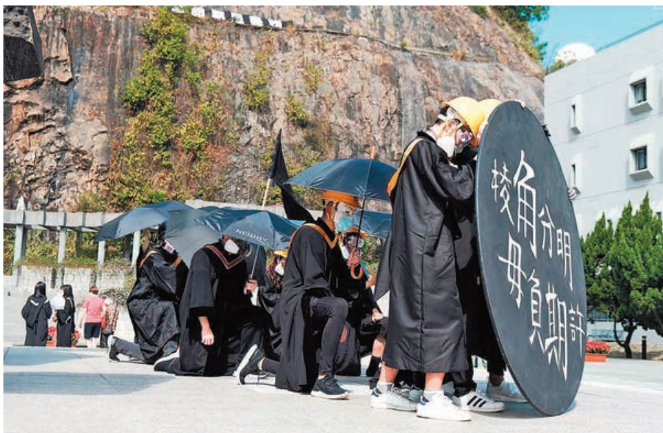
■「黃絲」搞事，將莊重的黑色畢業袍變為宣傳黑暴的工具。

業禮是總結大學生涯的重要日子，大家應抱有尊重態度，而非趁機肆意鼓吹違法信息。他又留意到，近日有機構公布全球大學就業能力排名，其中香港多所大學的排名大幅下滑，可見大學生的政治行徑早已令僱主的信心大跌。