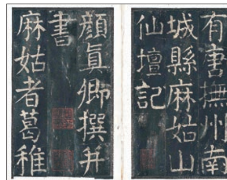
■入選國家《名錄》的唐顏真卿大字麻姑仙壇記。

今年有超過130家來自不同行業的跨國企業及大型機構參與。城大副校長（學生事務）葉豪盛教授表示，網上事業博覽於今年9月21日開始並原定10月16日結束，因反應熱烈而延長至10月30日，吸引逾8,000人次瀏覽網上職位展覽及近5,000人次參與各項網上事業活動，總參與人數高達逾13,000人，創歷史性紀錄。