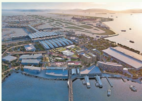
■新世界航天城項目總樓面380萬方呎。

新世界發展(0017)昨宣布，旗下位於香港國際機場的航天城項目，正式命名為「11 SKIES」，項目樓面面積380萬方