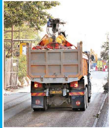
■將軍澳堆填區經常有重型泥頭車出入，壓壞路面。