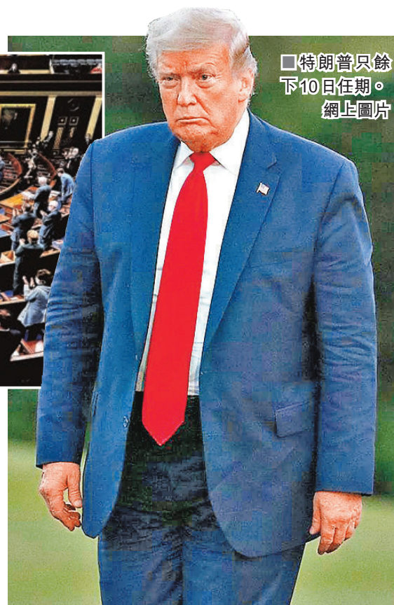
■特朗普只餘下10日任期。

示會考慮彈劾的內布拉斯加州參議員薩斯，以及希望特朗普即刻離任的阿拉斯加州參議員穆爾科夫斯基後，只有賓夕法尼亞州參議員圖米前日強調，特朗普犯下「理應彈劾的罪行」，不過並未表態會否支持彈劾。7名已承認候任總統拜登勝選的共和黨籍眾議員前日則去信拜登，希望他「遵照憲法精神」，出手阻止彈劾進程。