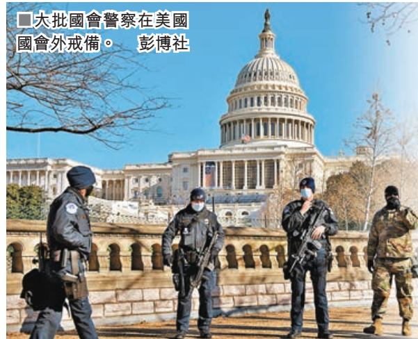
■大批國會警察在美國國會外戒備。