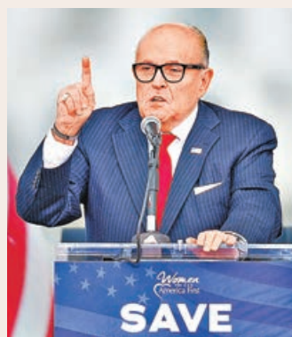
■朱利亞尼或再為特朗普上陣，為其被彈劾辯護。

知情人士指出，特朗普上月底致電拉芬斯柏格辦公室首席調查員，對方當時負責在科布縣核對郵遞票簽名的工作。特朗普於通話中軟硬兼施，一如他本月初與拉芬斯柏格通話時的語調。目前未知特朗普如何查找該名選舉調查員，但在特朗普本月初致電拉芬斯柏格前，曾嘗試聯絡州務卿辦公室至少18次，但轉駁至誤以為來電是惡作劇的新聞處實習生，故未有接通電話，特朗普最終在白宮幕僚長梅多斯安排下，與拉芬斯柏格進行通話會議。