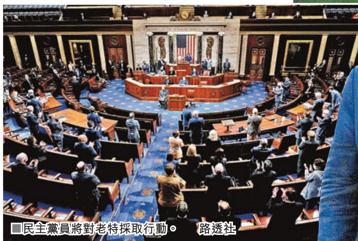
■民主黨員將對老特採取行動。

德肖維茨上周五向新聞網站《Politico》表示，能夠為特朗普辯護，將是他的榮幸，但後來改口稱「捍衛美國憲法和第一修正