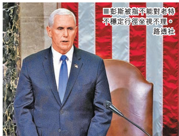
■彭斯被指不能對老特不穩定行徑坐視不理。

美國總統特朗普煽動支持者發起國會暴亂，遭到各界譴責。據美國有線新聞網絡（CNN）引述消息稱，此前無意援引憲法二十五修正案罷免特朗普的副總統彭斯，如今已無法對特朗普「愈發不穩定」的狀態坐視不管，不排除罷免特朗普，但憂慮此舉或國會發起彈劾，可能促使特朗普作出危害國家安全的行為。另一方面，眾議院計劃今日正式對特朗普提出彈劾，指控他「煽動暴亂」。