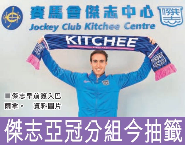
傑志早前簽入巴爾拿。