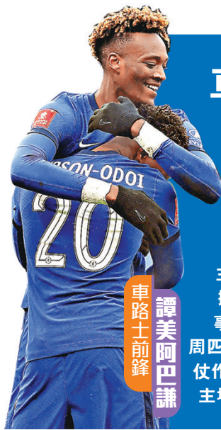
車路士前鋒 譚美阿巴謙