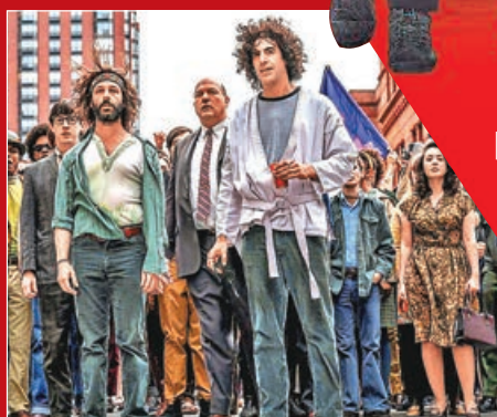
■《芝加哥七人案：驚世審判》有望角逐今屆奧斯卡。