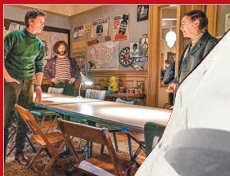
■《芝加哥七人案：驚世審判》劇照。

2020年10月Netflix上架的劇情片《芝加哥七人案：驚世審判》(The Trial of The Chicago 7)，原定於9月院線上映，但由於疫情影響派拉蒙影業宣布撤檔，改為在Netflix全球上映。影片改編自真實歷史，由執導過《新聞編輯室》、《社交網絡》的阿倫索金(Aaron Sorkin)擔任編劇兼導演，講述1968年的芝加哥民主黨全國大會抗議活動中，7名因煽動暴亂罪名被捕的反戰人士接受審訊的事件。影片將背景各異的7位年輕人經歷，在荒謬的審判入罪現場一一展現，引發關於正義、真相、民主、自由的追問。不少網民認為，該片有望角逐今年奧斯卡獎項。阿倫索金的影片最大特色就是台詞量大，靠對話推動情節、以對話銜接鏡頭，在此之中形成了獨特的節奏與氛圍，這一點值得留意。