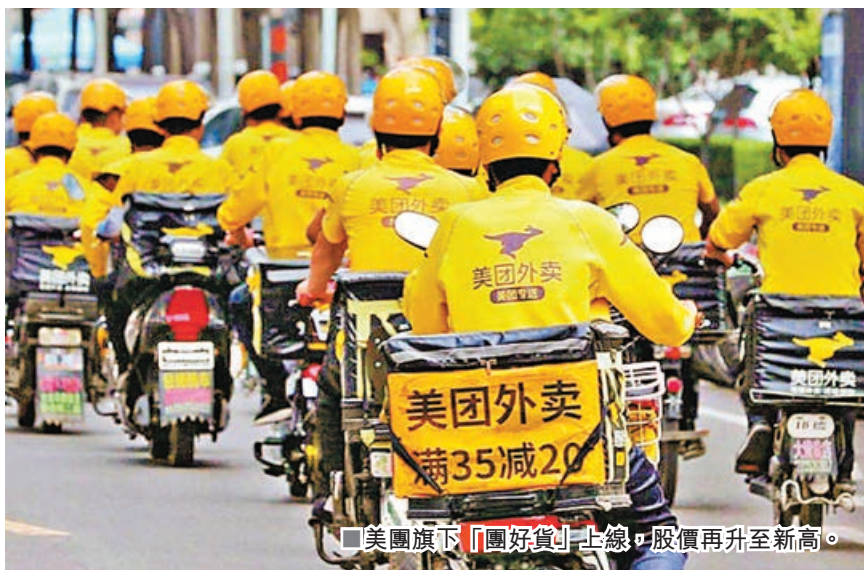
■美團旗下「團好貨」上線，股價再升至新高。

港股跟隨A股伸延升勢，恒指漲了560多點，重越30,000點水平來收盤，但在港股通繼續停開的情況下，大市成交量仍處於年內的低位水平，錄得不足1,800億元的成交量。A股在鼠年最後一個交易日進一步衝高，多項指數包括滬深300以及上綜指等等，都創出了新高點，情況對於港股帶來了刺激推動。