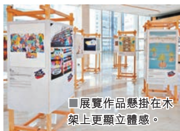
■展覽作品懸掛在木架上更顯立體感。

漫步銅鑼灣鬧市，抬頭望，見巨型壁畫滲透出文化訊息，調整腳步，感受一下藝術所帶來的觸動與美好。希慎集團去年舉辦的「希慎壁畫設計大賽2020」，吸引眾多才華橫溢的藝術愛好者參賽。大賽以身心健康(Wellness)、可持續發展(Sustainability)、藝術與文化(Art & Culture)、生活品味(Lifestyle)為主題，希望為利園區帶來更多藝術色彩。