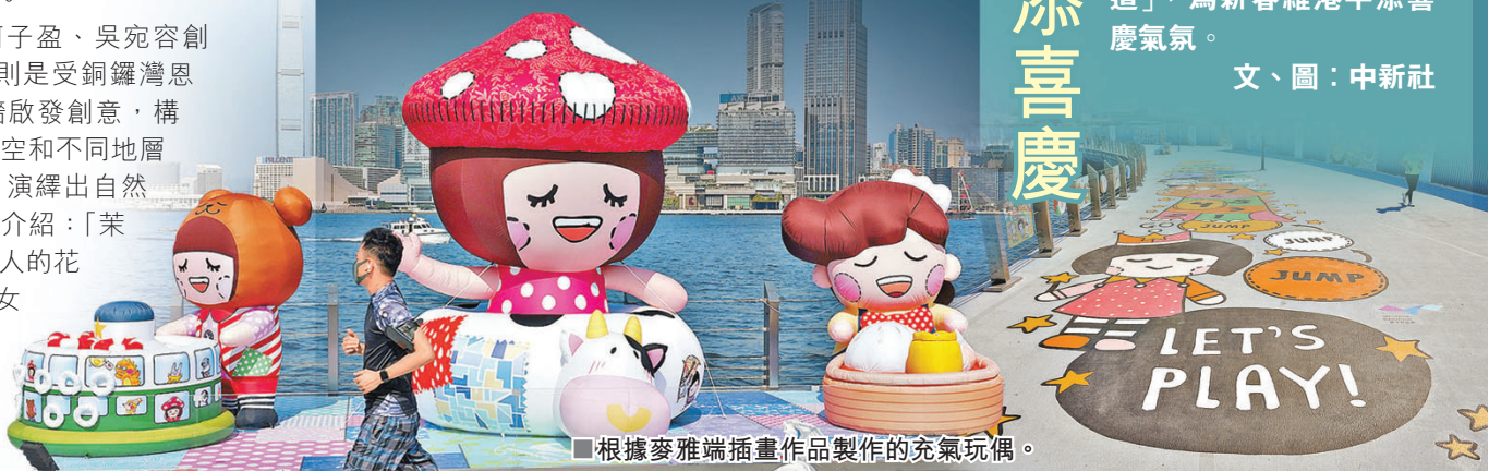
■根據麥雅端插畫作品製作的充氣玩偶。