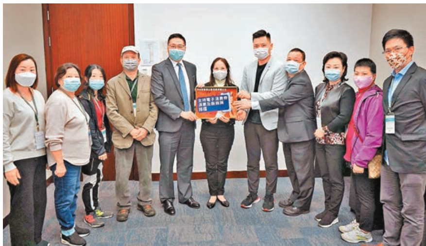
多位立法會議員與食物環境衛生署署長黃淑嫻(中)會面。

政府去年曾推出過「街市非接觸式付款資助計劃」，為街市檔戶提供每檔劃一5,000元資助，用以支付為街市顧