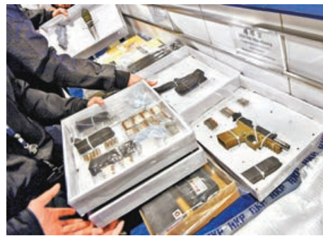
警方去年偵破多宗涉及真槍實彈案件。

為堵塞有不法之徒利用現時法例有關「槍械」定義的漏洞，保安局決定提出修例建議，清楚定義真槍元件，以打擊槍械案件。局方昨日在立法會保安事務委員會簡介建議，有議員認為，走私真槍及真槍元件的案件數字上升，促請局方做好把關工作。