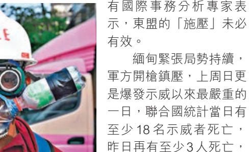
■緬甸一名示威者戴着簡單的防催淚彈裝置。

緬甸緊張局勢持續，軍方開槍鎮壓，上週日更是爆發示威以來最嚴重的一天，聯合國統計當日有至少18名示威者死亡，昨日再有至少3人死亡，其中西北部城鎮卡爾有20多人受傷。