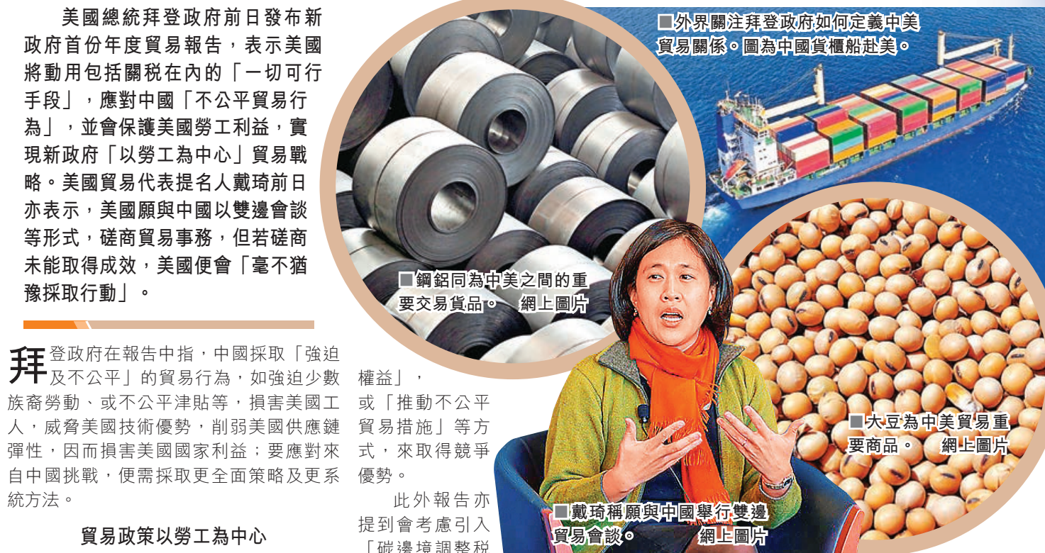
■外界關注拜登政府如何定義中美貿易關係。圖為中國貨櫃船赴美。