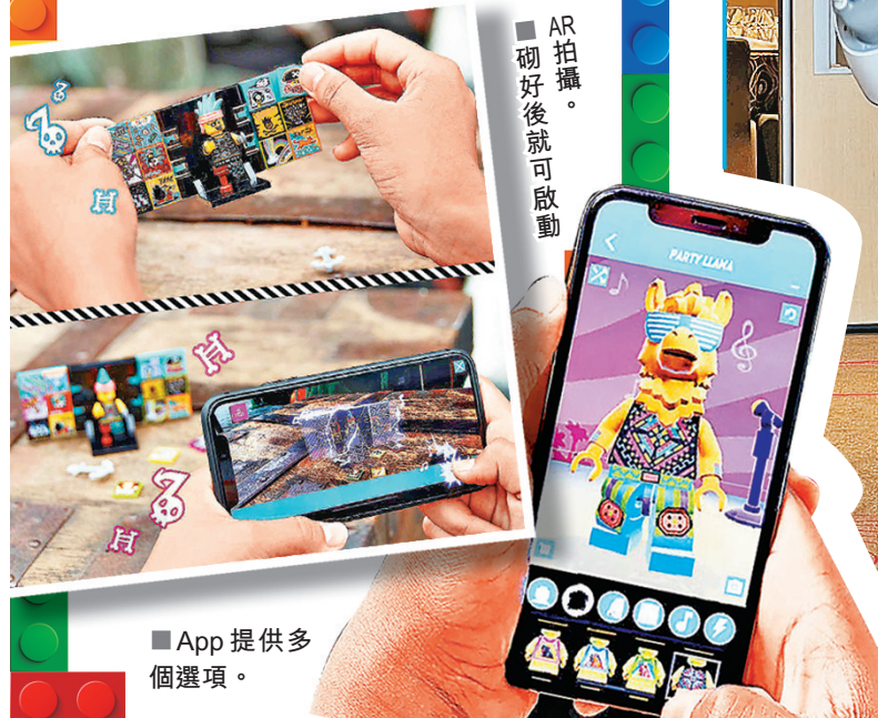
AR拍攝。砌好後就可啟動

首批產品包括6款對應不同音樂風格的「Beatbox」包括外星人、糖果美人魚、嘻哈機器人BeatBox、駱駝人、海盜及獨角獸，各有16塊「Beatbits」，另有共12款舞者的「Bandmates」，每款均有3塊「Beatbits」，互相湊合，不難創作出與別不同的MV。「Beatbox」各售19.99美元，以隨機抽取形式發售的「Bandmates」每款售4.99美元。