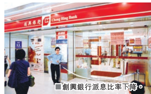
■創興銀行派息比率下降。

宗建新指，港元拆息去年跌幅較大，相信再跌空間不大，料銀行淨息差下跌壓力相對減少。