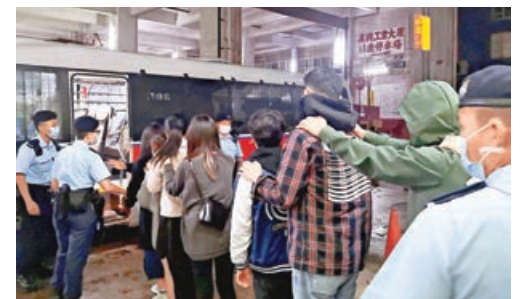
警方在觀塘一間無牌酒吧拘捕多名男女帶署扣查。

事發後被撞的白色豐田私家車車尾凹陷，泵把飛脫，更留有相信屬於傷者的血漬。至於肇事黑色平治房車則停在油站石壁及支柱前，車頭損毀，部分汽車零件散落地，另有一個染血的口罩及一支油槍。兩車司機並無受傷。