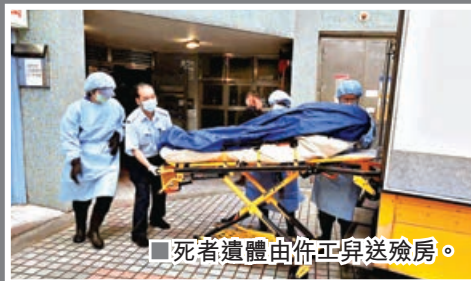
死者遺體由傭工昇送殮房。