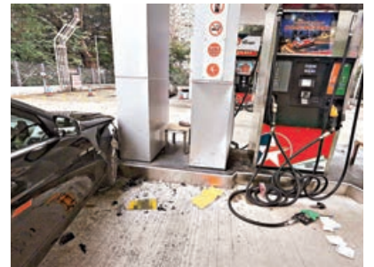
肇事私家車零件散落地。上。

沙田大埔公路沙田嶺段加德士油站發生罕見車禍，一輛平治房車昨晨7時許失控衝入油站，猛撼一輛正在加油的豐田私家車尾，再反彈撞向油站石壁及支柱才停下，期間一名正加油的女職員走避不及，慘遭被撞擺尾的私家車夾在車身與油站支柱之間浴血昏迷。意外發生後，姓俞（28歲）男司機報稱是在行駛期間突然「跣胎」致失控，他涉嫌危險駕駛引致他人身體受嚴重傷害被捕。