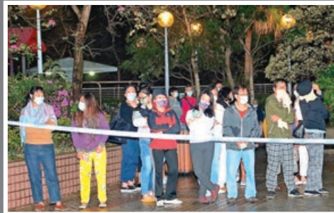
大批居民自行疏散到樓下暫避。