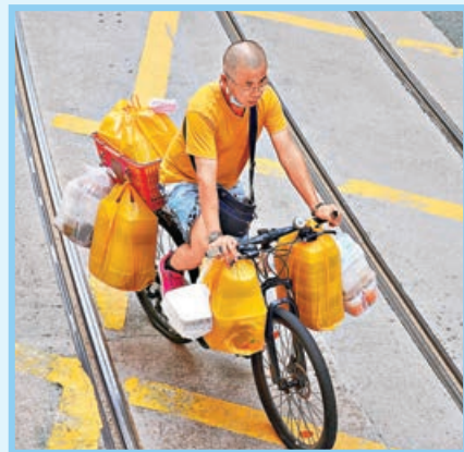
外賣送餐在疫情之下需求大增。