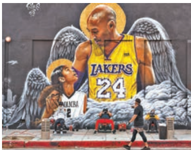
■高比和女兒早前墜機遇難。

此外，蕭華也談到其他問題，雖然他們預期下季一切會恢復正常，包括正常從10月進行到8月82場常規賽與季後賽賽程，但他也說下季沒有舉行海外例行賽或表演賽