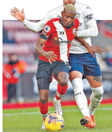
曼城對修咸頓近6次交手曼城全勝。