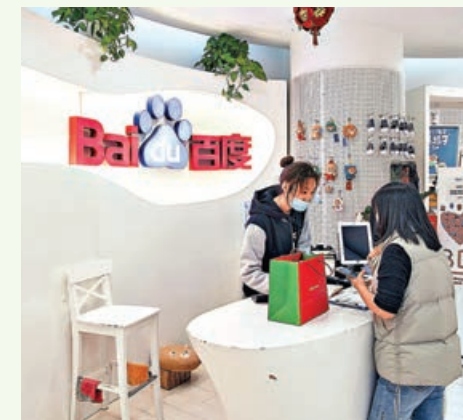
百度料以W股形式上市。

美債息回軟，金融股下挫。滙控(0005)旗下滙豐及恒生(0011)被穆迪列入觀察名單，可能調低信貸評級。滙控跌2.1%，恒生亦跌0.4%。