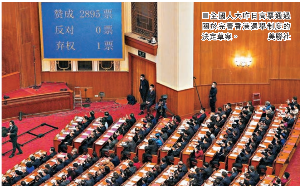
■全國人大昨日高票通過關於完善香港選舉制度的決定草案。

十三屆全國人大四次會議昨日以高票表決通過《全國人民代表大會關於完善香港特別行政區選舉制度的決定》(決定)，通過對選舉委員會重新構建並賦權，建立符合香港實際情況的新的民主選舉制度。選委會由過往的4個界別、1,200人擴增至5個界別、1,500人，負責提名行政長官候選人、立法會議員候選人，及負責選舉行政長官候任人、立法會部分議員。決定提出，設立香港特區候選人資格審查委員會，負責審查並確認選委會委員候選人、行政長官候選人和立法會議員候選人的資格。全國人大授權全國人大常委會根據決定修改香港基本法附件一和附件二。