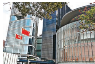
■「愛國者治港」助港長治久安。

家內政是違反國際法，外國政府早前因香港國安法實施而制裁 12 名特區官員，她強調特區政府管治團隊不會害怕威嚇。