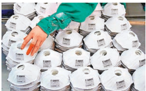
中國製造的口罩等防疫商品，對美國防疫起了一定作用。

特朗普政府2019年宣布對約1250億美元的中國商品加徵15%關稅，隨後在去年1月中美簽署的第一階段貿易協議中，關稅稅率從15%降至7.5%。其中部分商品此前已被暫時豁免關稅。而直