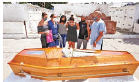
巴西疫歿數字因變種新冠肺炎再見新高。

巴西新冠病毒接種計劃進度緩慢，只有880萬人已打首針，佔全國人口4.2%。雖然研究顯示輝瑞疫苗可有效中和變種毒株「P1」，但巴西政府現時與輝瑞洽購疫苗僅達成口頭協議，而輝瑞早在去年8月已提出向巴西提供7,000萬劑疫苗，但被巴西衛生部拒絕。