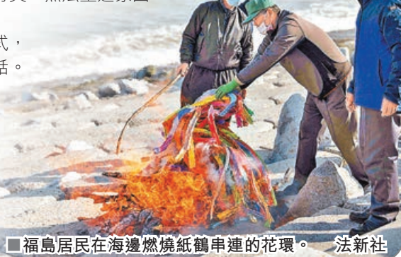
福島居民在海邊燃燒紙鶴串連的花環。

據日本《每日新聞》報道，為了救助災民和振興災區，日本政府已經投入了超過31萬億日圓，在曾遭海嘯襲擊的岩手縣和宮城縣沿海地區，建成多個防災能力強的新型城鎮，但由於福島核事故的影響，福島縣仍有大片土地無法進入，超過3.5萬名曾經生活在這裏居民無法重返家園。