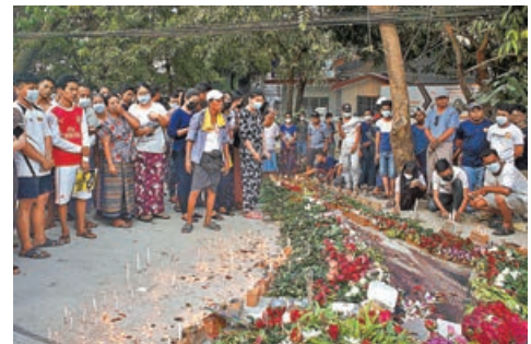
仰光的北達貢鎮為一名遭軍方射殺的示威者舉行燭光悼念。

不過另一邊廂，美國則繼續加大對緬甸制裁，前日宣布制裁緬甸國防軍總司令敏昂萊的兩名成年子女和他們所控制的6家公司。國務卿布林肯警告說，美國可能會採取更多的懲罰性行動。