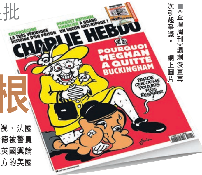
■《查理周刊》諷刺漫畫再次引起爭議。網上圖片

不滿漫畫將事件與弗洛伊德案相提並論。英國種族平權智庫蘭尼米德信託基金行政總裁貝居姆形容，漫畫從任何層面而言都不可接受，批評內容難以令人發笑，亦不構成對種族主義的批判，反而貶低種族歧視的議題及令人感到冒犯，又指嘲笑壓迫者才是諷刺，而不是嘲笑被壓迫、被邊緣化的人。另一個名為「支持公義非裔及亞裔律師」的組織，則批評周刊「以弗洛伊德的創傷作盈利之用」。