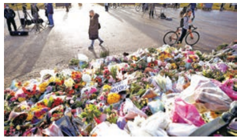
■英國大量民眾以鮮花悼念被害女生。

多數為女性，他們哀悼遇難的埃弗拉德，抗議獨自外出時缺乏安全感，還有人對在場的警察高呼「你們真丟人」。據報道，原定的「為埃弗拉德守夜」活動因新冠疫情防疫規定而被取消，但仍有人聚集為埃弗拉德守夜。警方負責人稱「任何守夜活動都是非法的，而且是不安全的。」