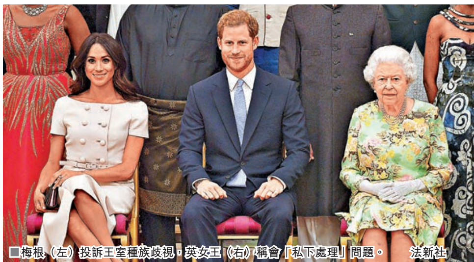
■梅根(左)投訴王室種族歧視，英女王(右)稱會「私下處理」問題。

英國哈里王子及夫人梅根早前在專訪中，指控英國王室種族歧視，法國《查理周刊》新一期頭版於是刊登諷刺漫畫，藉去年美國黑人弗洛伊德被警員跪頸殺害一事，將英女王描繪成跪頸壓在梅根之上。漫畫一出即引起英國輿論不滿，批評周刊種族歧視及冒犯英女王，就連過去一星期站在梅根一方的美國輿論，也不滿周刊藉弗洛伊德案來「抽水」。