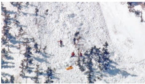
■長野縣救援人員在雪崩現場進行搜救。網上圖片

雪崩地點位於海拔約2,400米、大約在乘鞍岳半山腰處，屬於滑雪場上方的滑雪區外，崩塌的雪場面積寬約200米、長約300米。警方表示，昨日上午10時左右，有登山者報案說「發生雪崩，有登山客被捲入。」目擊者說，雪崩發生時約有5名看似登山客的人受波及，附近約20名登山客馬上進行搜救工作。報道指，5名登山