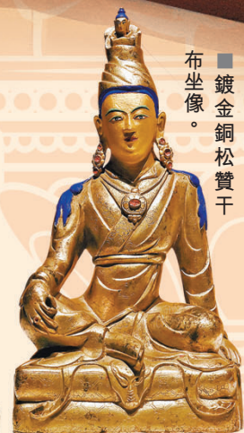
鍍金銅松贊干布坐像。

據介紹，隨着文化交流和新材料新技術的運用，唐卡出現了繡絲、堆繡、刺繡、織錦等工藝製成的唐卡，用料考究，工藝精湛，為唐卡藝術寶庫增添了新的光彩。展覽展出的「時輪根本續布畫唐卡」「彩繪釋迦牟尼傳記唐卡」「密集金剛貼花唐卡」等均為藏地唐卡的典型代表。