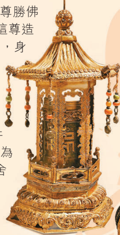
鍍金銅指捻轉經筒