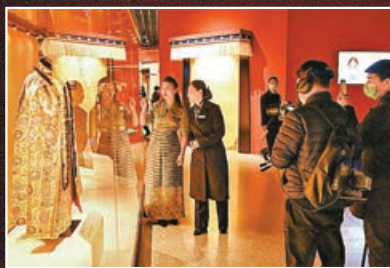
展覽線上線下同時開啟。