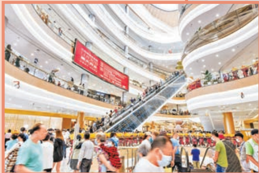
■免稅城可成為內地消費回流的新增長點。圖為三亞海旅免稅城吸引民眾前來購物。