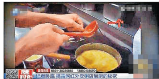
■福州有「網紅粥舖」被揭員工未洗手即抓取食材，甚至將吃剩排骨撈出回收熬製。

羅湖正在重點推動以羅湖、文錦渡和蓮塘三大口岸為核心的深港口岸經濟帶發展。《徵求意見稿》中明確提出，「十四五」期間，該片區將在高端商務服務、專業服務等重點領域企業與香港機構開展合作，全力推動基礎設施「硬聯通」和體制機制「軟聯通」，促進要素高效便捷跨境流動，進一步擴大對外開放，不斷提升國際化水平，打造集中端消費、專業服務和現代金融於一體的國家級深港合作平台。重點打造五個區域：在羅湖口岸與人民南片區打造國際醫療商務試驗區，在文錦渡口岸片區打造灣區知識經濟自貿區，在蓮塘口岸片區打造深港民生協同發展區，在蔡屋圍南片區打造跨境創新金融實踐區，在深南東片區打造區域文化生態典範區。