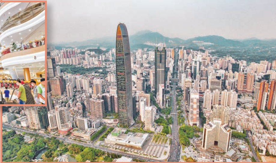
■羅湖區將在毗鄰羅湖口岸的國貿大廈建設粵港澳大灣區免稅城。

據悉，深圳正在着力推進免稅經濟發展，規劃建設多個免稅消費中心。其中，深圳羅湖區將在毗鄰羅湖口岸的國貿大廈建設粵港澳大灣區免稅城，積極爭取市內免稅政策落地，打造全球高端商品銷售平台吸引消費回流，同時也將作為國貨精品展示平台，支持自主品牌走出去。有分析人士認為，免稅業正在成為深圳建設國際消費中心城市的新發力點，也是內地消費回流的新增長點。