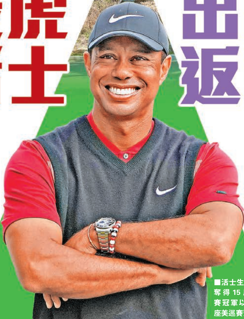
■活士生涯已奪得15座大賽冠軍以及82座美巡賽冠軍。